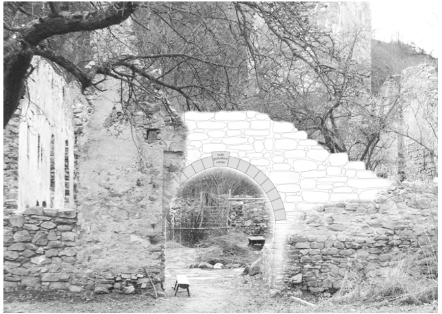
Skizze des künftigen Torbogens

Auch dieses Jahr sind wieder alle freiwilligen Helfer herzlich willkommen. Für Speis und Trank ist gesorgt und die richtige Arbeit für jede Profession ist vorhanden.